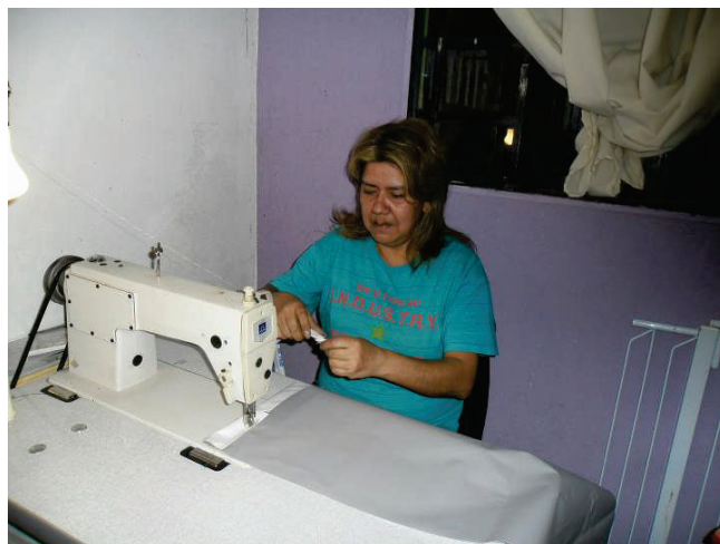
Este é um dos momentos que surge um novo produto