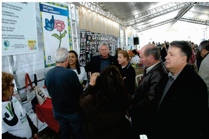
Apresentação dos produtos produzidos