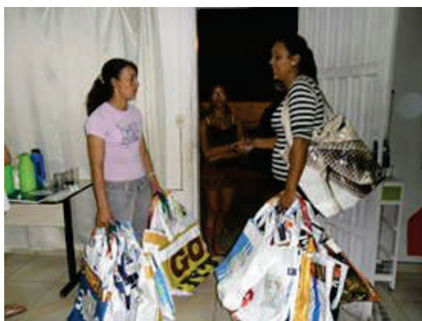
Associação de moradores com as sacolas prontas