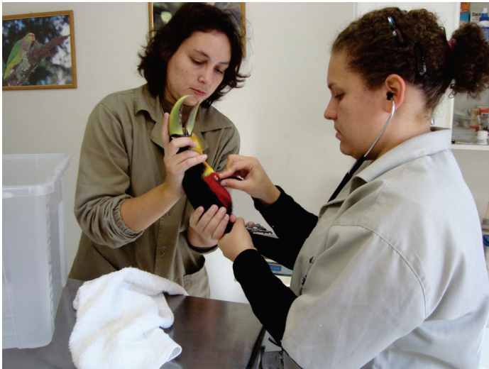
Tucano Tratamento Na Clinica