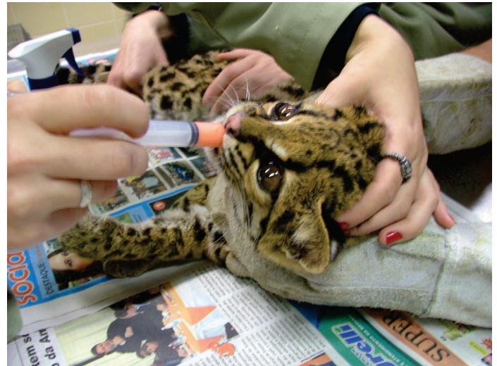
Gato Maracajá Em Tratamento