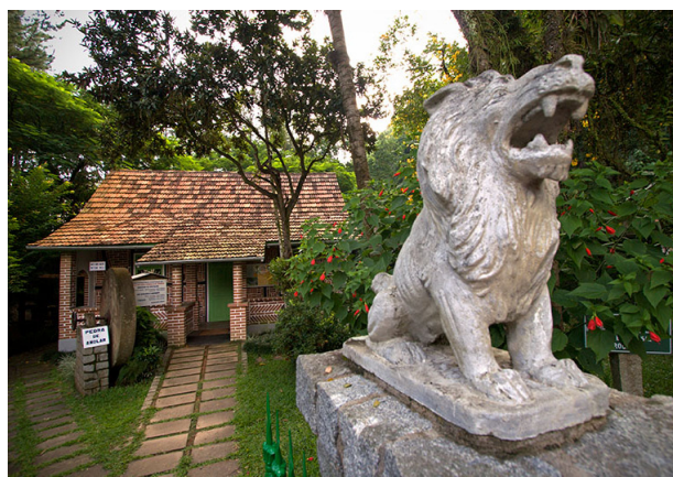
Museu Wolfgang Weege - Parque Malwee