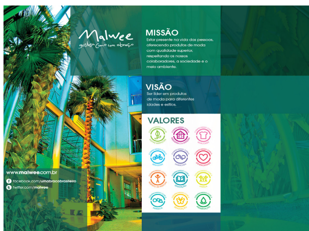
Missão, Visão e Valores da Malwee