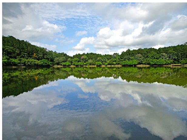
Uma das lagoas do parque, onde são preservadas diversas espécies de peixes