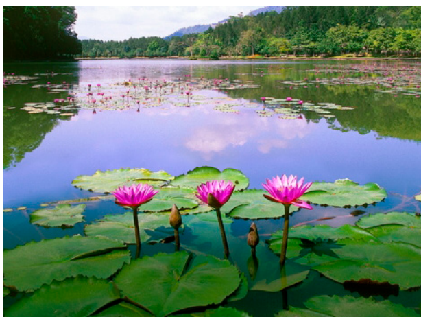
Lagoa, diversidade de espécies