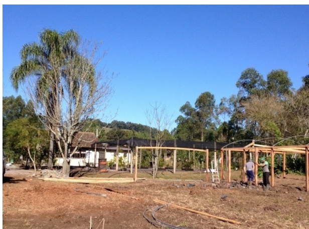
Montagem da Estufa