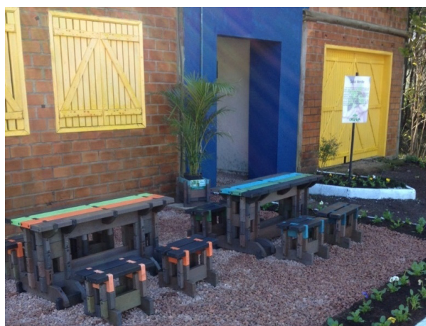
Fachada modificada para atender as crianças