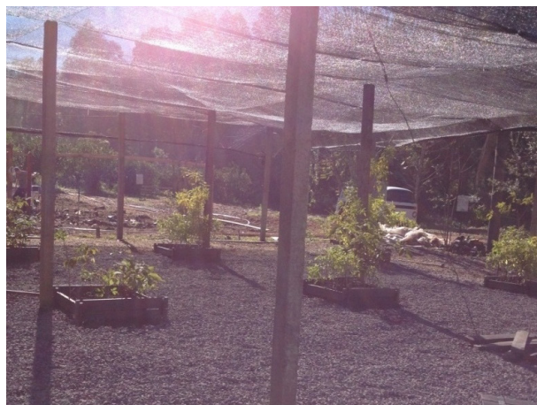
Montagem do Viveiro