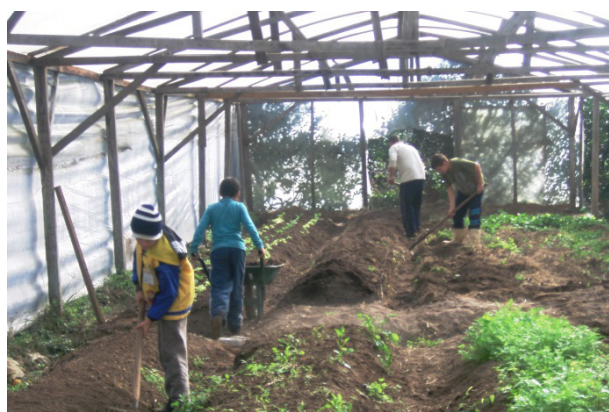
Área destinada a Horta