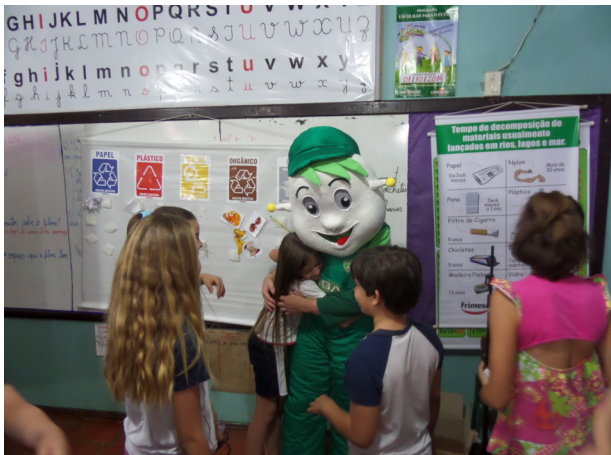
Interação do boneco “Verdiso” e alegria das crianças