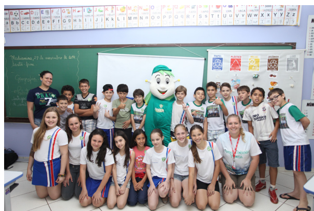
Projeto de Educação Ambiental em escolas da cidade de Medianeira Paraná