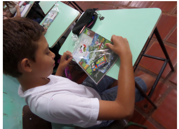
Cartilha ambiental + caderno de pinturas para complementar o interesse das crianças sobre meio ambiente