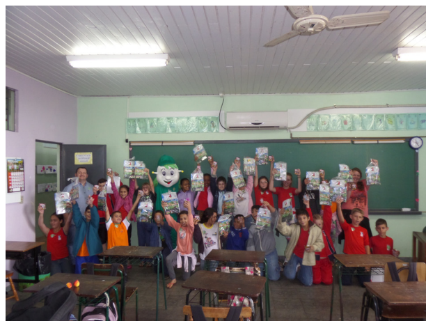
Projeto de Educação Ambiental em escolas da cidade de Marechal Candido Rondon - Paraná