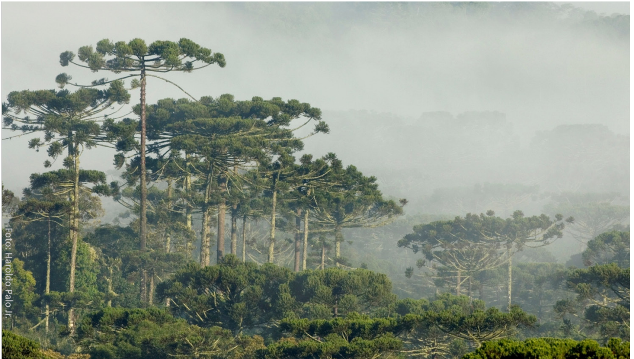
Floresta com Araucária - Projeto Araucária +