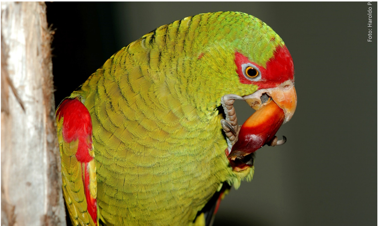
Papagaio Charão - Projeto Araucária +