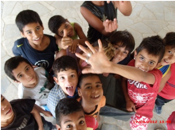
Classificação de resíduos