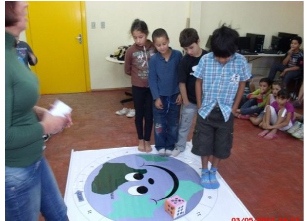
Jogo Caminho do Mundo Sustentável