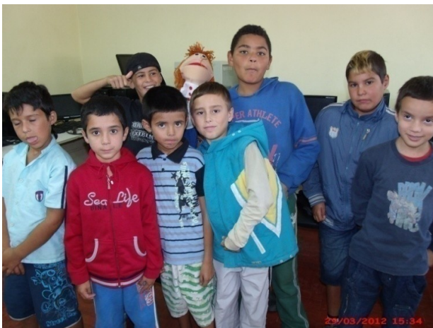
Princípios da Carta da Terra