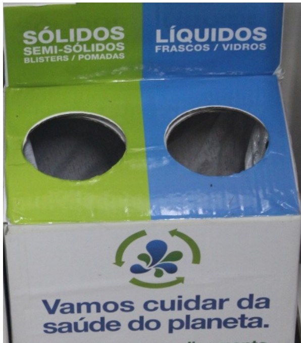
Coletor de medicamento