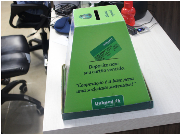
Coletor de Cartão