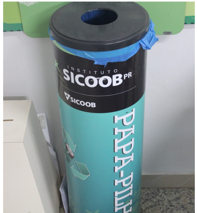
Coletor de pilhas e baterias