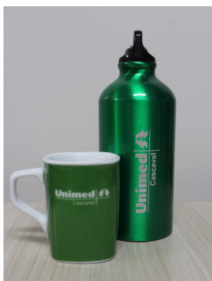
Copo para caneca