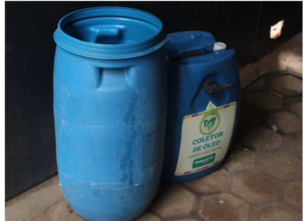
Coletor de óleo