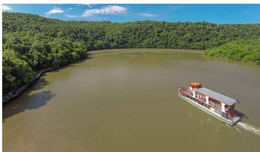
Atrativo de Visitação - Aniversários de Visitação do Parque Estadual Fritz Plaumann