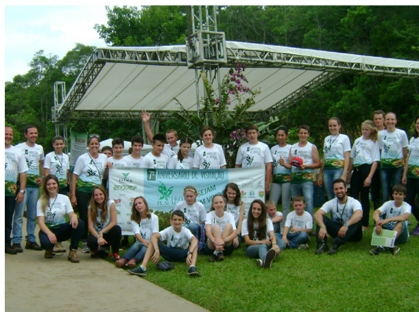
Guias Mirins - Aniversários de Visitação do Parque Estadual Fritz Plaumann