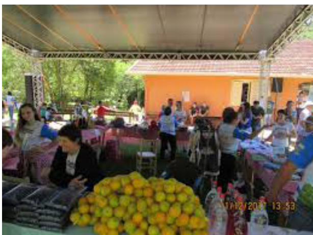
Feira Agricultura Familiar - Aniversários de Visitação do Parque estadual Fritz Plaumann