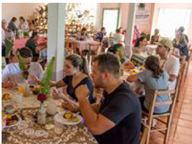
Café Colonial - Aniversários de Criação do Parque Estadual Fritz Plaumann