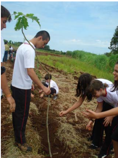
Plantio de mudas