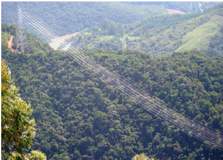
Figura 2: vão entre as torres 1 e 2. A estrada ao fundo é um dos acessos existentes quando da construção das linhas.