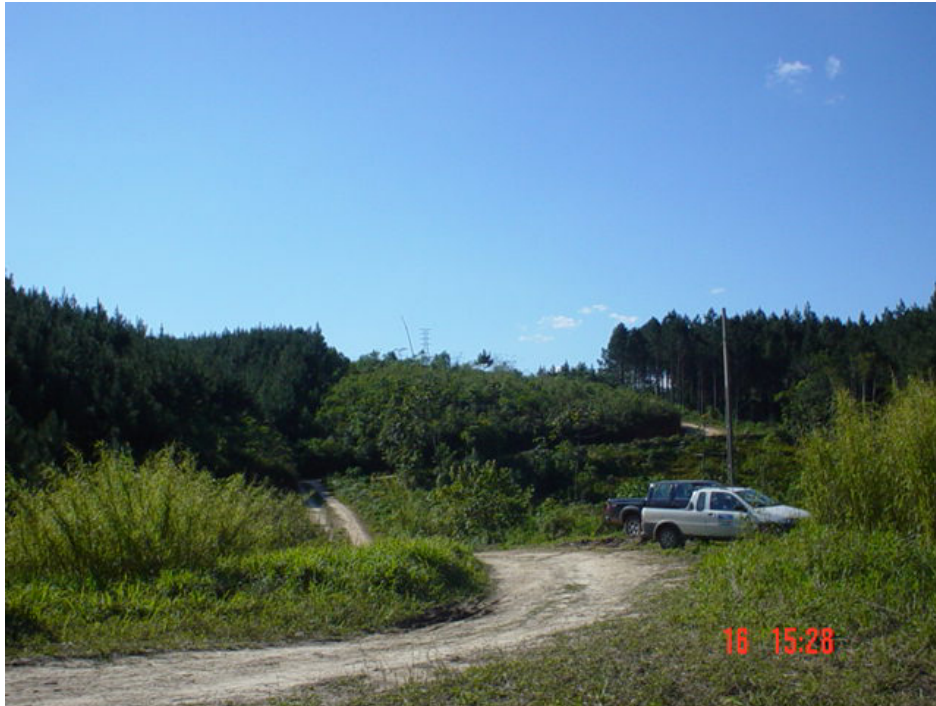
Figura 2: acessos existentes.