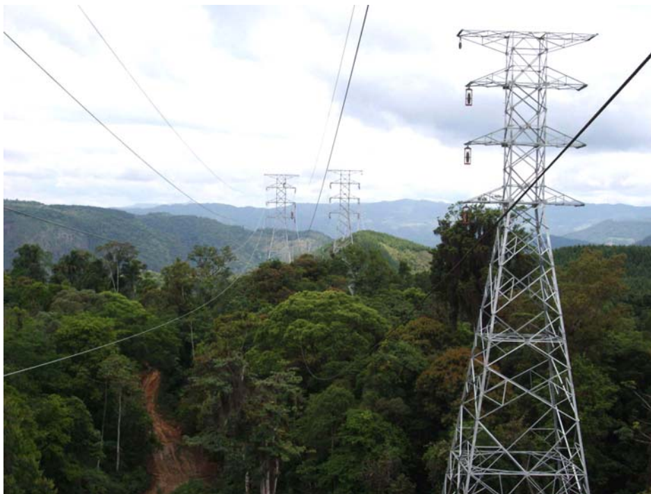
Figura 4: panorâmica das linhas. A estrada à esquerda é um dos acessos existentes quando da construção das linhas.