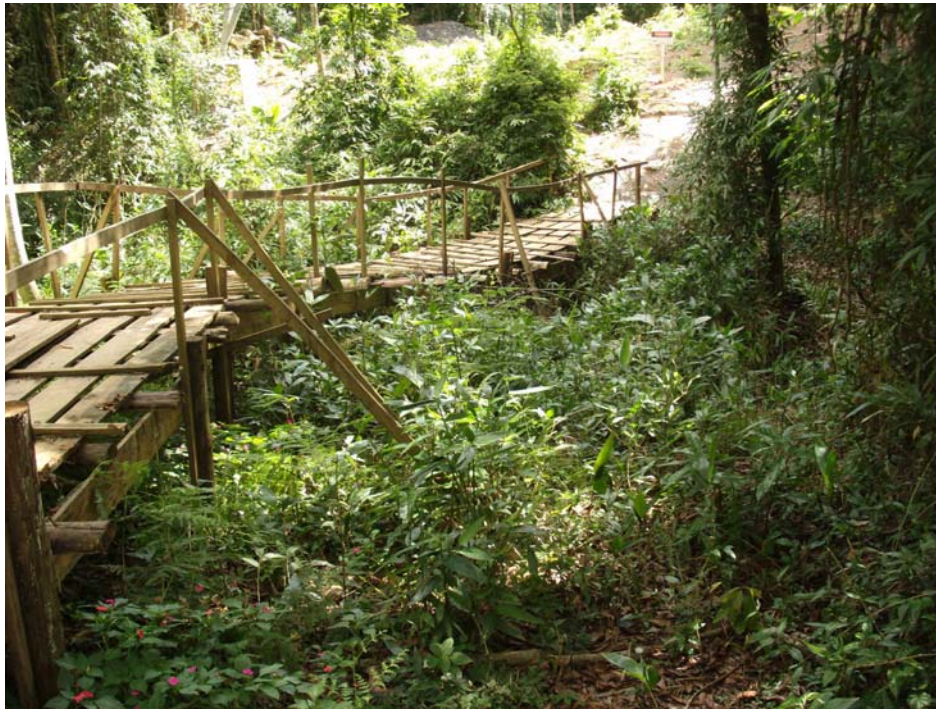
Figura 3: passarela sobre a mata nativa.