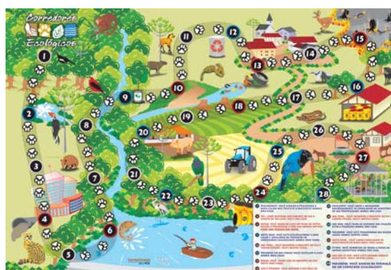
Fig. 3 – Jogo produzido pelo projeto

Para produção dos vídeos foram captadas 16 horas de imagens do trabalho e da região.