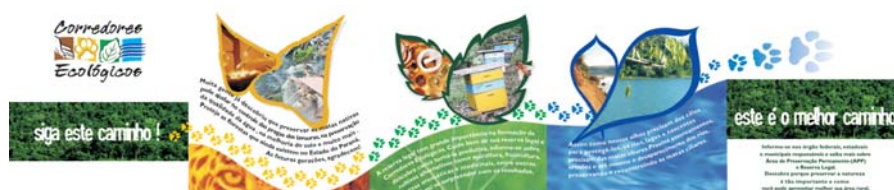
Fig. 4 – Frente do folder produzido pelo projeto