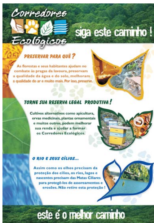
Fig. 6 – Cartaz produzido pelo projeto