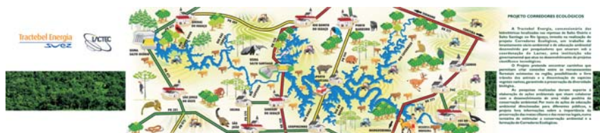
Fig. 5 – Verso do folder produzido pelo projeto